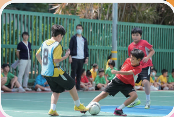
五年級同學在運動場上進行足球較量。

體驗日當天分別進行足球、籃球、田徑等比賽，學生們在賽場上拼盡全力，出演一場又一場精彩的賽事，透過運動賽事有效促進學生間的友誼、團結及公平競爭的奧林匹克精神，提升對運動的興趣，培養正面價值觀。