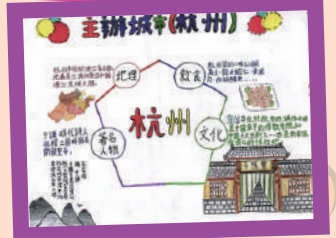
學生運用腦圖，整理搜集的資料，增加對主辦城市杭州的認識。