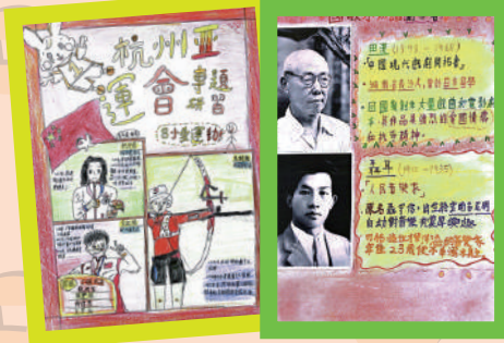
在進行研習過程中，學生透過資料搜集，加深對國歌及中國運動員的認識，提升國民身份認同。