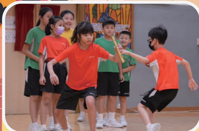
四年級同學在禮堂進行接力比賽，氣氛熾熱。