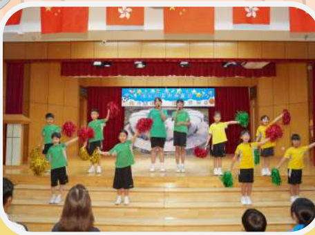
學生代表特別獻唱杭州亞運主題曲《同愛同在》，為本校「杭州亞運會跨學科專題研習活動」的閉幕禮帶來完美的謝幕。