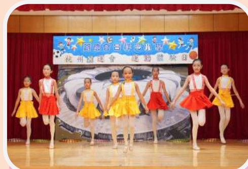
本校芭蕾舞校隊於舞蹈中加入運動元素，充滿動感及創新意念。