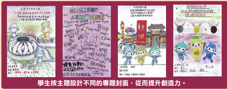
學生按主題設計不同的專題封面，從而提升創造力。