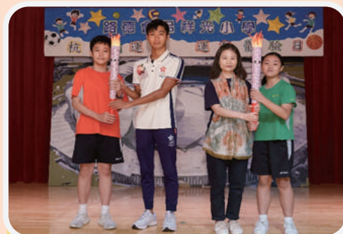
杭州亞運會三項鐵人混合接力賽銅牌得主兼香港三項鐵人運動員黃子圖於閉幕上為學生作出勉勵，並與黃校長一同將火炬傳遞予學生，象徵傳承及弘揚體育文化與精神，鼓勵學生繼續努力，為國爭光。