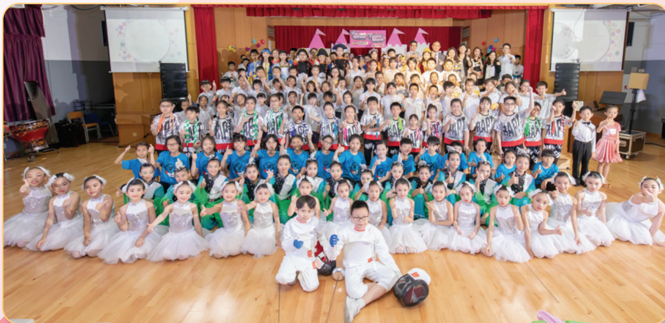
全體表演學生與師長及來賓合照