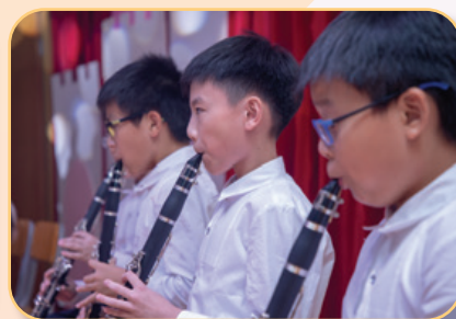
西樂團(單簧管小組)