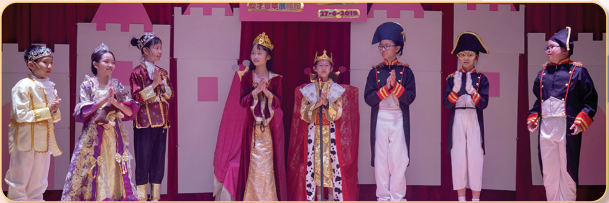
學生司儀以話劇形式介紹每個表演項目，非常特別。