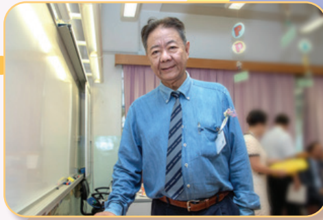
校監戎子由博士出席本活動以示支持。

本校於2019年6月27日舉行優才匯萃展繽紛 The Gifted Talent Show，讓學生展示學習成果。匯演除了讓學生增添自信外，亦為在場來賓留下深刻的印象，十分成功。學生從中得到的鼓勵，成為他們日後發揮其獨有恩賜與才能的助力。