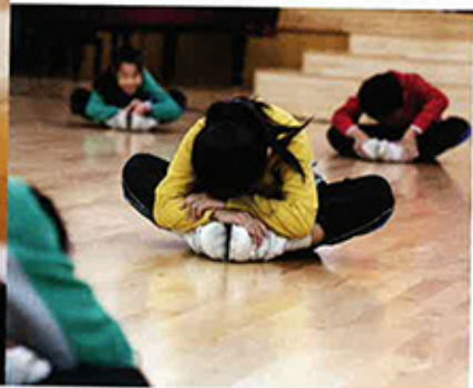
與興趣班的學生大多是从基本功學起

相較大部分校隊，現時呂祥光小學劍擊隊員的訓練目標也較純粹，「以往一些傳統名校，他們的學生會對學校的劍擊隊很有歸屬感，也覺得入隊是件光榮的事，然後很有目標要為學校增光，贏獎牌，但這裡因為校隊歷史很短，學生未必有這樣的負擔，心態很單純，他們只是有興趣，家人幫他們報了名就來練。」這份直接，在滿足競爭的香港校園卻顯得很難得，也如劍擊這項在以往被視為貴族運動的項目，終走入位處新界西北的呂祥光小學，成為一項在地、平民化的運動，為學生帶來美好的時光。