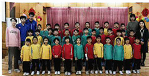
路德會呂祥光小學劍擊隊

「初初開辦時家長都很熱烈，只是他們意識到劍擊需要的裝備都不便宜，故此部份學生在學習中卻步。」屋邨學校學生家庭背景相對樸素，也未必熟悉劍擊，要延續學生學習的路，校長與劍擊全方位惟有雙管齊下，「一方面我們向家長講解學劍擊的好處，一方面教練方面就提供部份裝備，裝備放置於校內，訓練時學生就可以輪流使用。」一年下來，興趣班在跌碰間保存下來，其中表現較佳的學生，更成為去年9月新增設的劍擊校隊中的第一批代表。