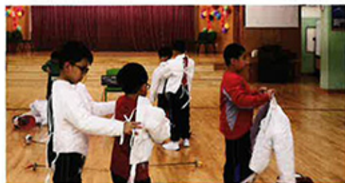
學生彼此為對方穿上劍擊服，在小節上培養了守望相助的精神